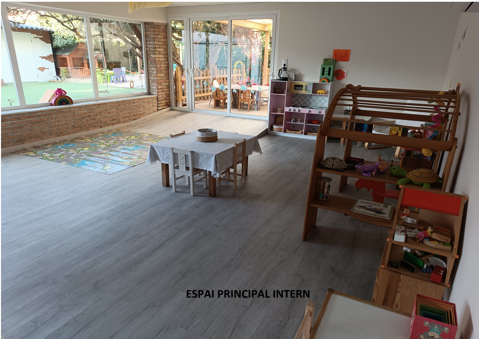
ESPAI PRINCIPAL INTERN